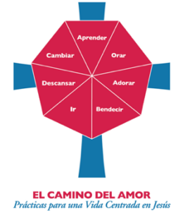
EL CAMINO DEL AMOR Prácticas para una Vida Centrada en Jesús

Ore siguiendo la Tercera Colecta de Adviento, que se encuentra en la página 126 del Libro de Oración Común . ¿De que manera la oración será su guía durante el resto de la semana? Reserve hoy un tiempo especial para centrar sus intenciones en fomentar la paz y difundir la alegría.